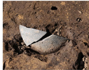
大型竪穴建物跡内遺物出土状況（南から）