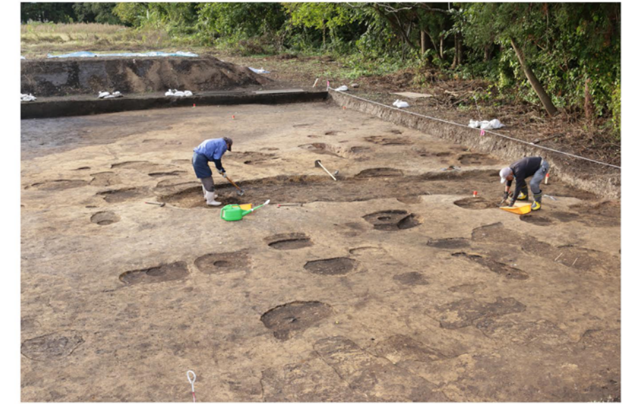
掘立柱建物跡検出状況（西から）