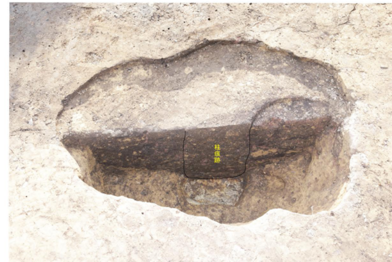
柱穴跡半裁状況（東から）