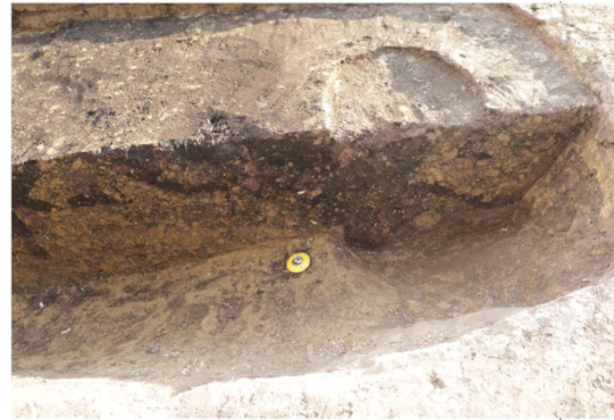
掘立柱建物柱穴半裁状況（北から）