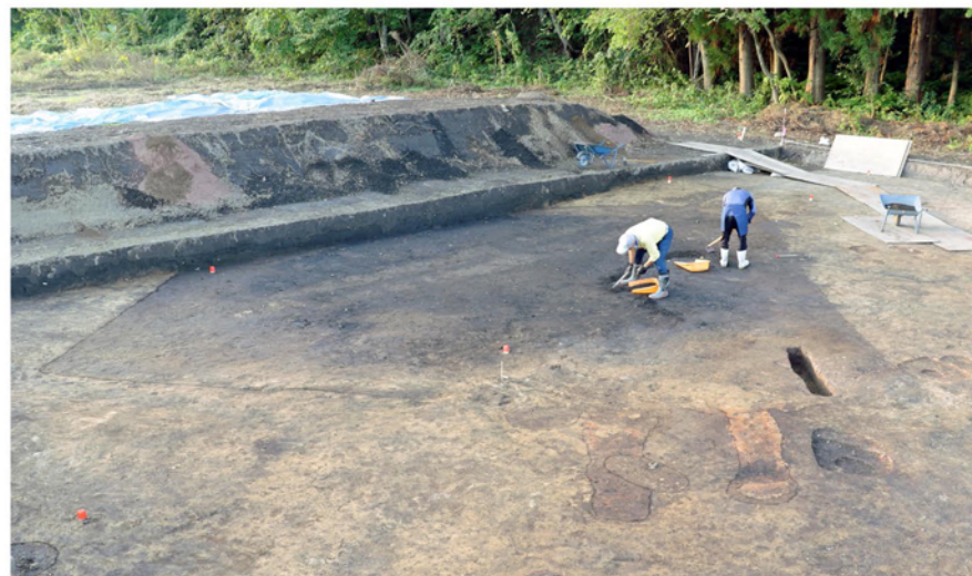
大型竪穴建物跡検出状況（南から）