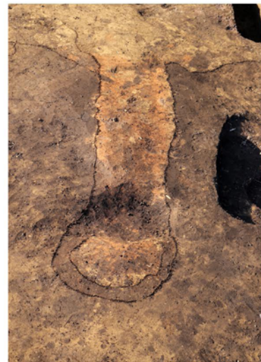
大型竪穴建物煙道跡（南から）