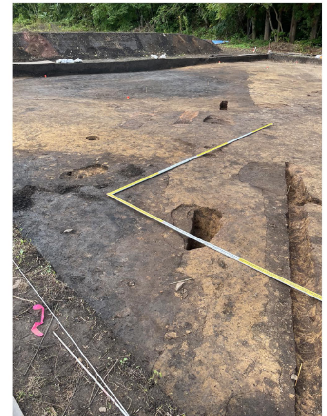
溝跡・竪穴建物跡・柱穴跡検出状況（南から）