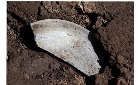
建物跡 3 出土須恵器蓋