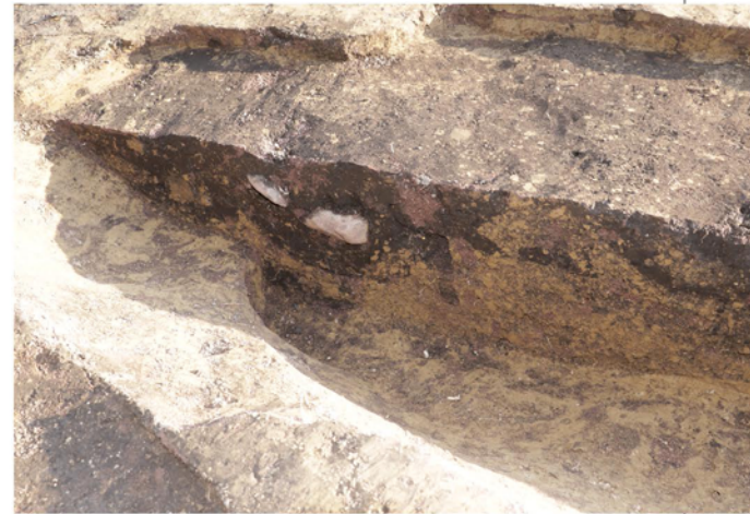
掘立柱建物柱穴半裁状況（北西から）